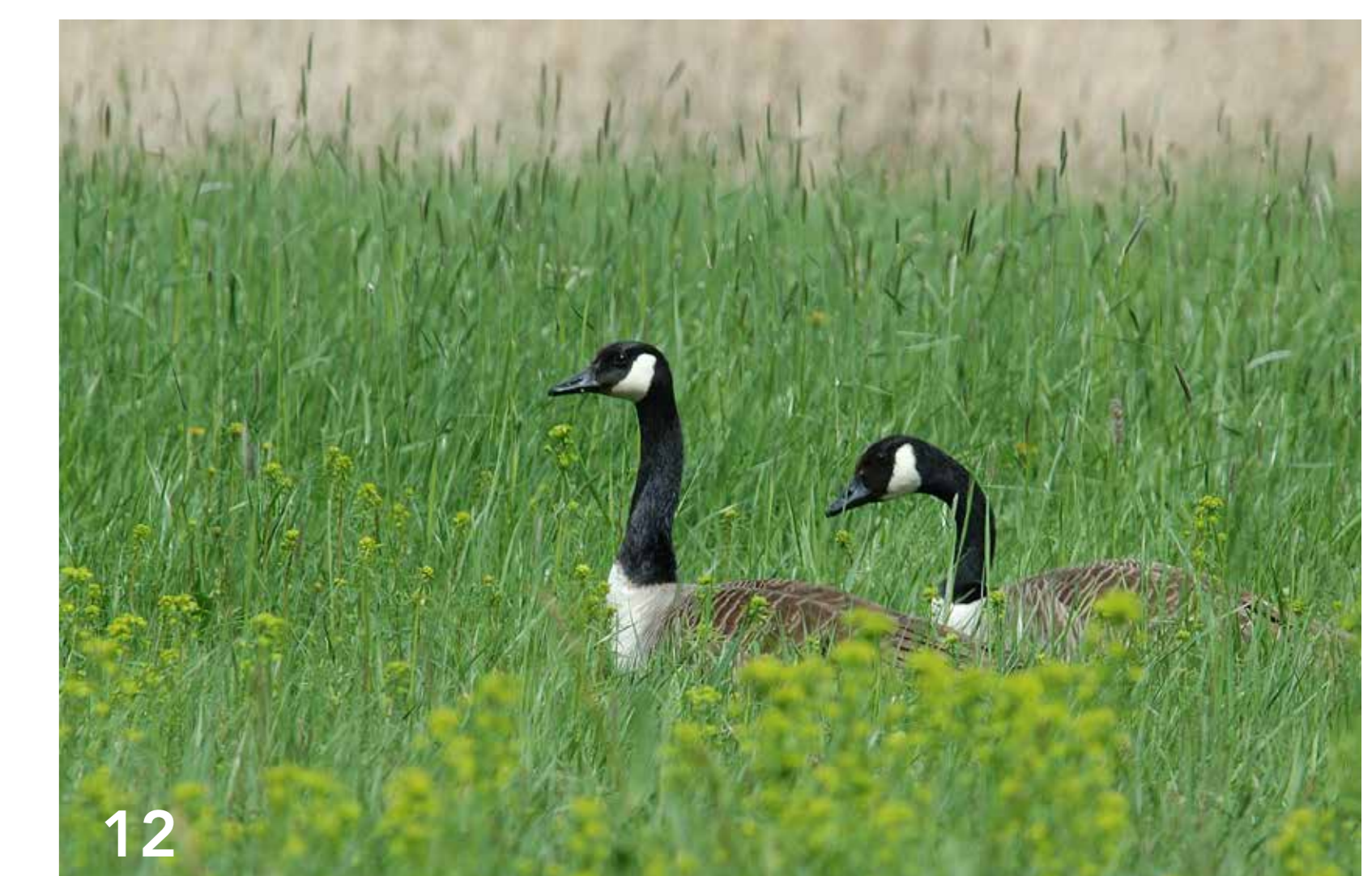
Die eingewanderten Kanadagänse sind nicht besonders scheu; man kann sie mit ihren Jungtieren oft beobachten.