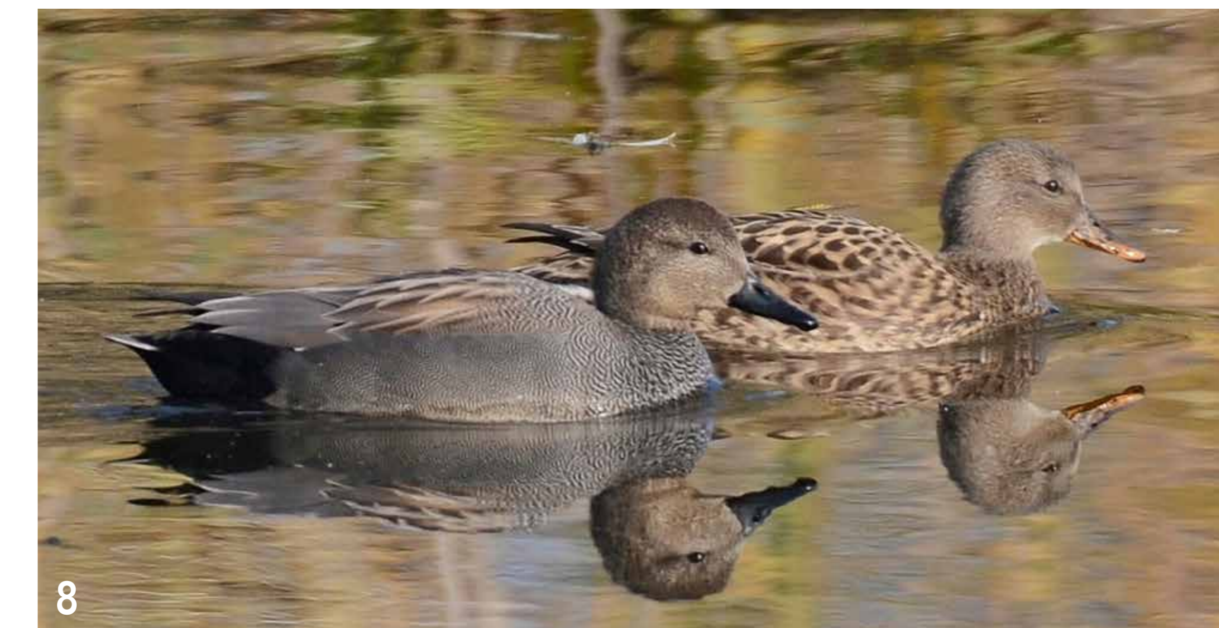
Die Schnatterente ist ein seltener Zugvogel, der in Nord- und Osteuropa brütet. Sie ist sehr scheu und flüchtet bei Störungen. Überwiegend ernährt sie sich von Wasserpflanzen und den Samen und Wurzeln von Gräsern.