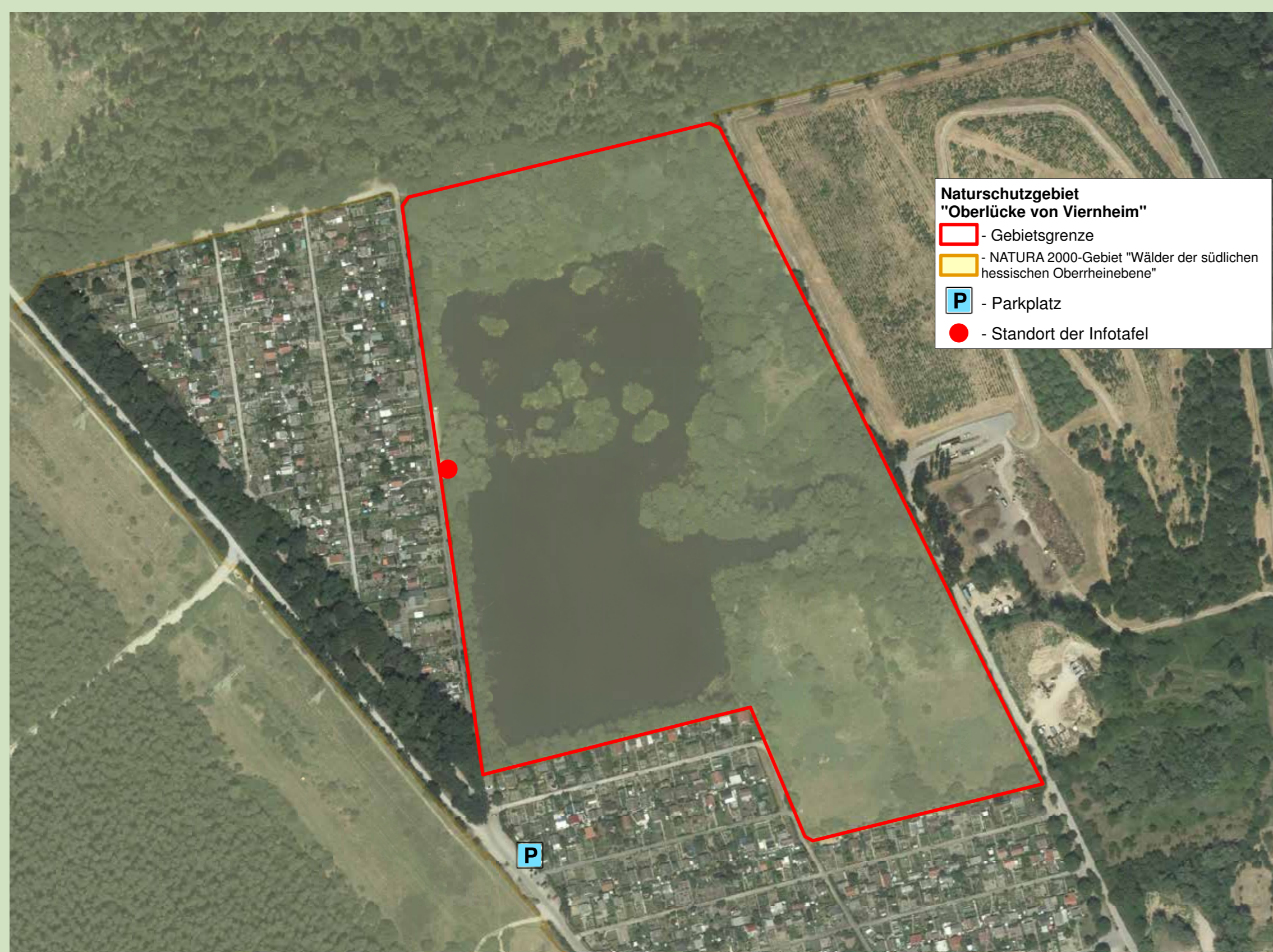
Datengrundlage: Topographische Karte 1:25000 (TK25), mit Genehmigung des Hessischen Landesamtes für Bodenmanagement und Geoinformation (HLBG)

Im Naturschutzgebiet gibt es keine Wege. Denn hier soll sich die Natur ungestört entfalten. Wir bitten Sie, sich an das Betretungsverbot zu halten.