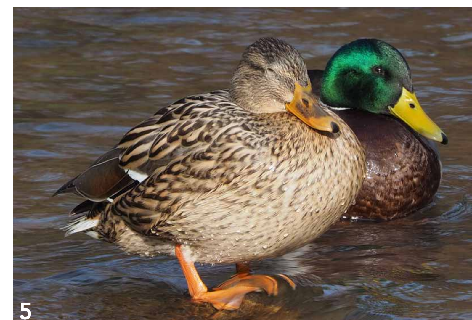
Die Stockente kommt fast überall vor, wo es Gewässer gibt. Sie frisst Pflanzen, die sie unter Wasser mit dem Schnabel abbeißt.