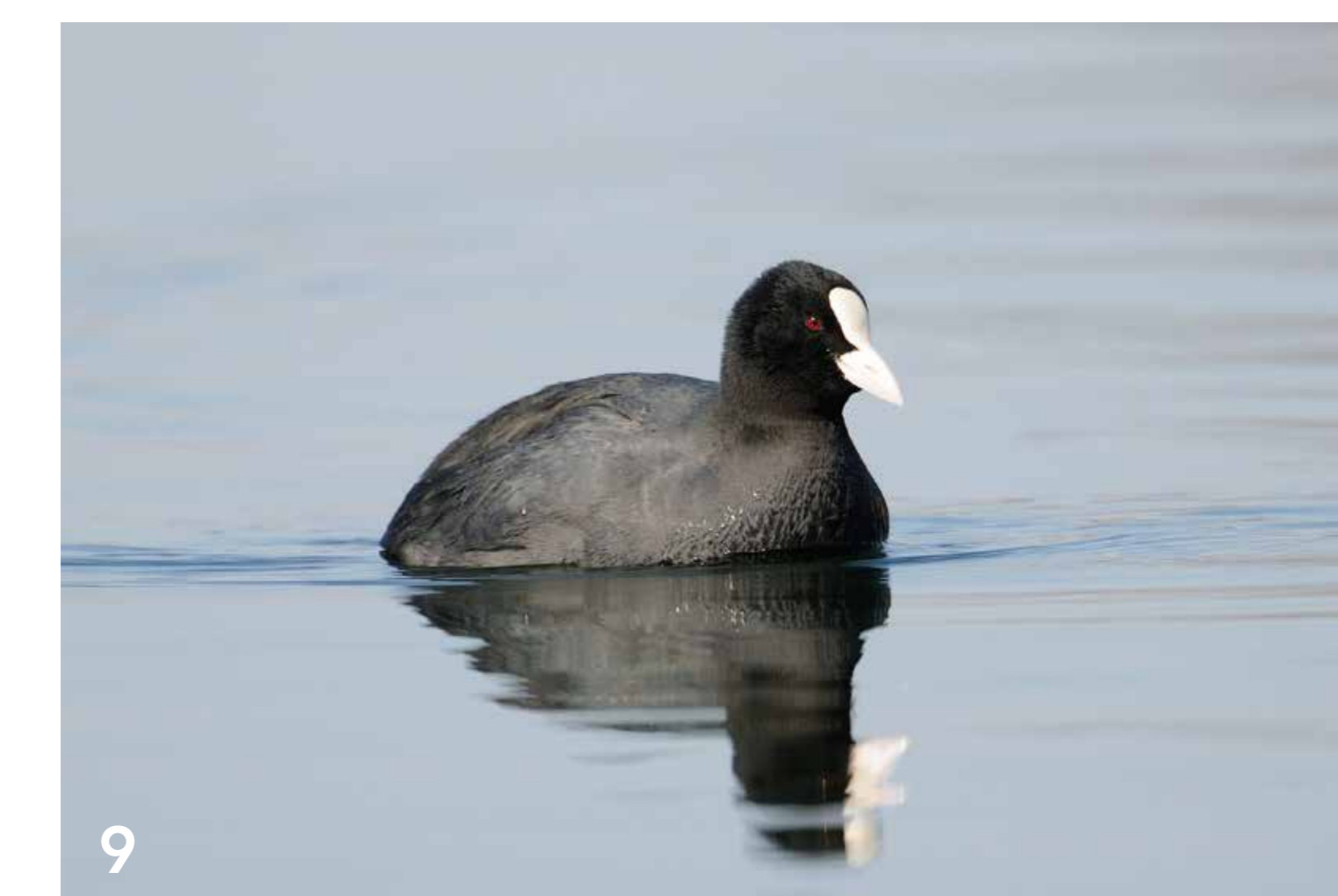
Das Bläßshuhn ist einer der häufigsten Wasservögel in Deutschland. Die Jungen sind Nestflüchter und können schon nach kurzer Zeit schwimmen.