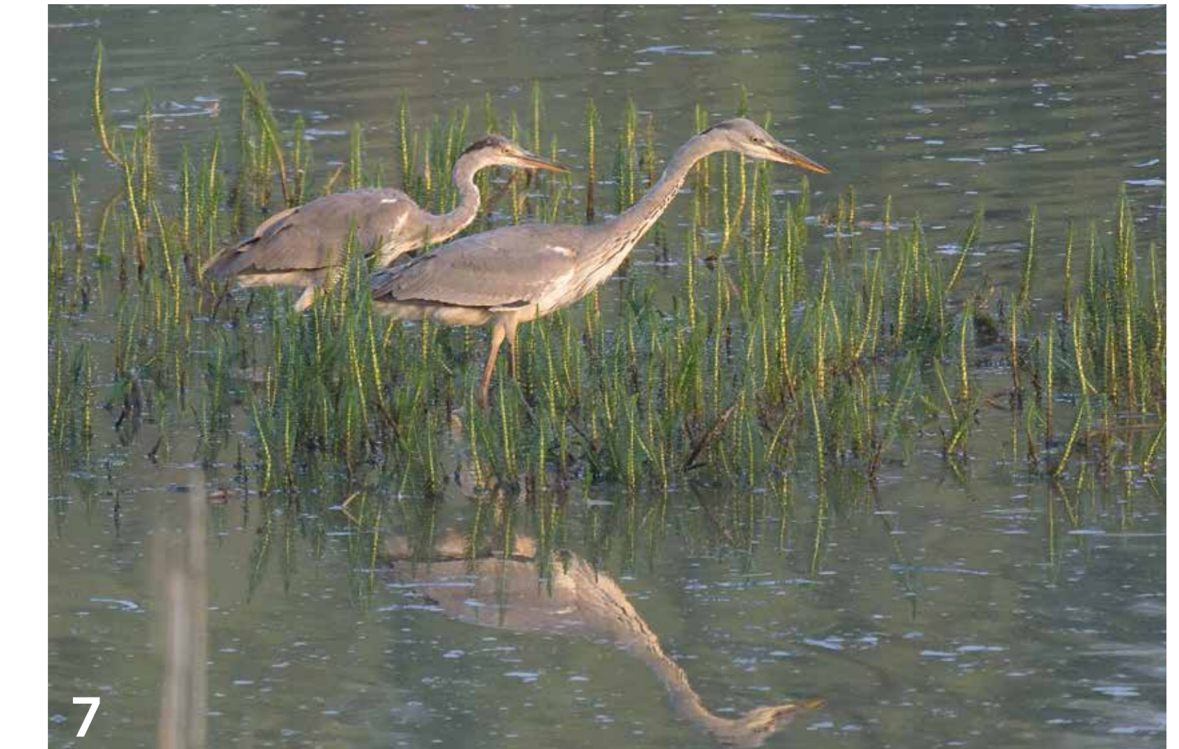
Der Graureiher nutzt die Uferzonen für den Fischfang.