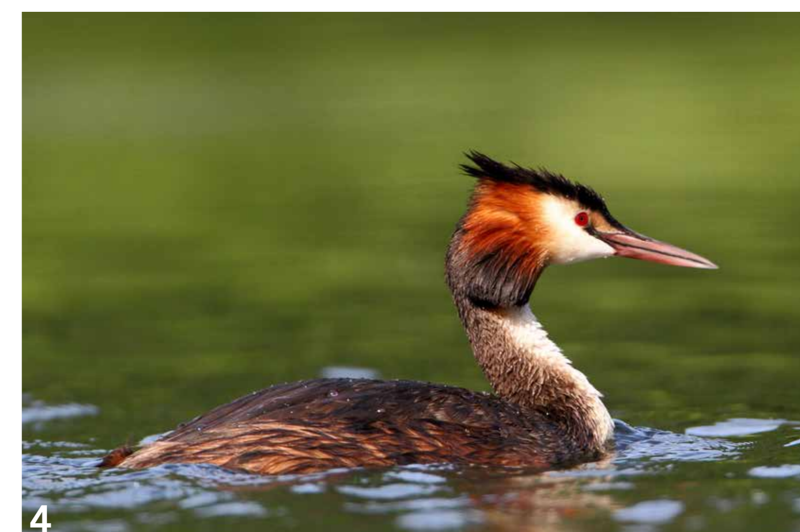
Der farbenprächtige Haubentaucher verschwindet oft von der Wasseroberfläche und taucht an einer anderen Stelle wieder auf.