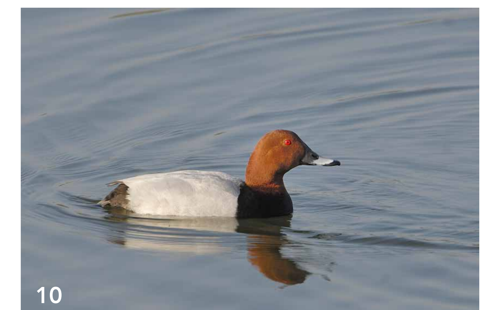
Die Tafelente brütet in Mittel- und Osteuropa. Sie besucht das Naturschutzgebiet im Winterhalbjahr auf dem Durchzug nach Süden.