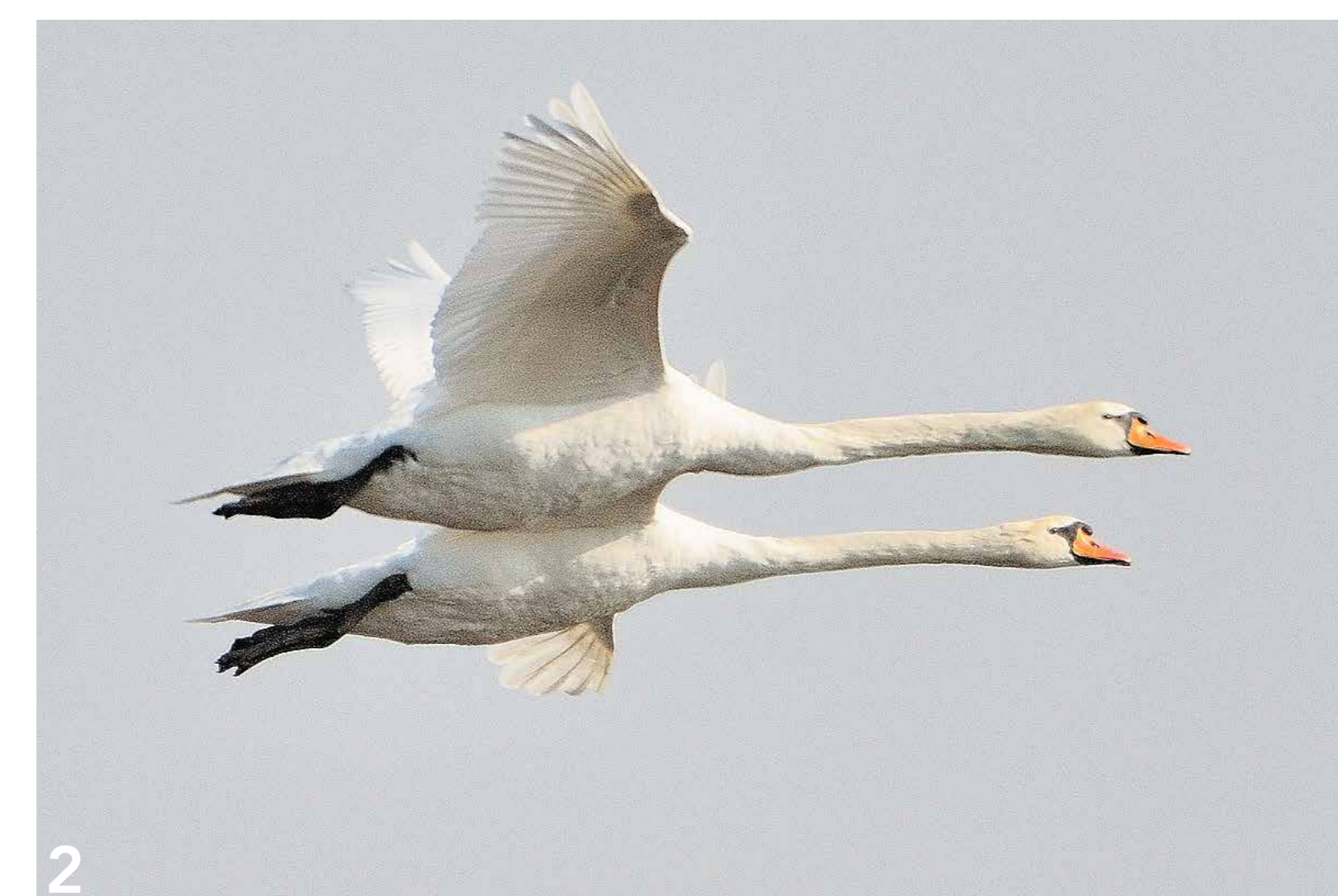
Der Höckerschwan gehört zu den schwersten flugfähigen Vögeln Mitteleuropas.

Das Naturschutzgebiet ist die Heimat vieler Wasservogelarten. Zwergtaucher , Haubentaucher , Höckerschwäne und Bläßhühner brüten hier. Ganzjährig kommen auch Graureiher und Kormorane zur Nahrungssuche ins Gebiet. Zu den Zugzeiten können rastende Entenarten wie Tafel- und Schnatterenten beobachtet werden. Seit den 90er Jahren brüten hier auch eingewanderte Kanadagänse und Nilgänse, die mit den heimischen Gänsen und Enten um Nahrung und Brutplätze konkurrieren und sie zunehmend verdrängen.