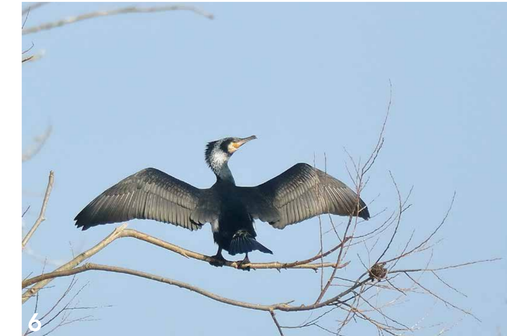
Das Gefieder des Kormorans eignet sich gut zum Tauchen. Nach der Fischjagd müssen die Tiere es wieder trocknen.