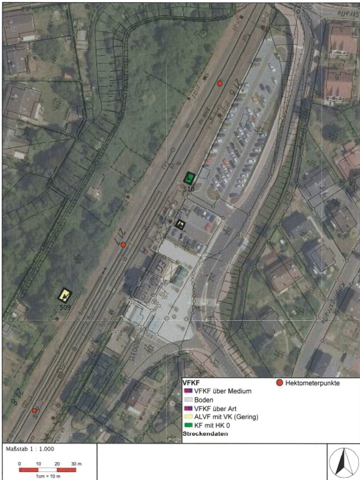
Abbildung: Lageplan der Verdachtsflächen