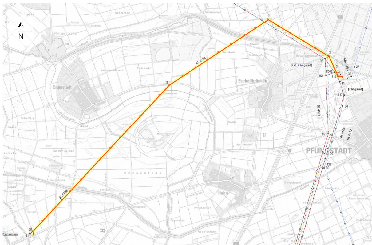
Abbildung 1: Lage der Maßnahme (ohne Maßstab)

Die Leitung verläuft durch die Gemeindegebiete von Pfungstadt, Riedstadt und Biebesheim. Dabei verläuft sie fast ausschließlich über landwirtschaftlich genutzte Fläche. Siedlungsgebiete werden nicht gequert. Die Lage der Maßnahme kann der Abbildung 1 entnommen werden.