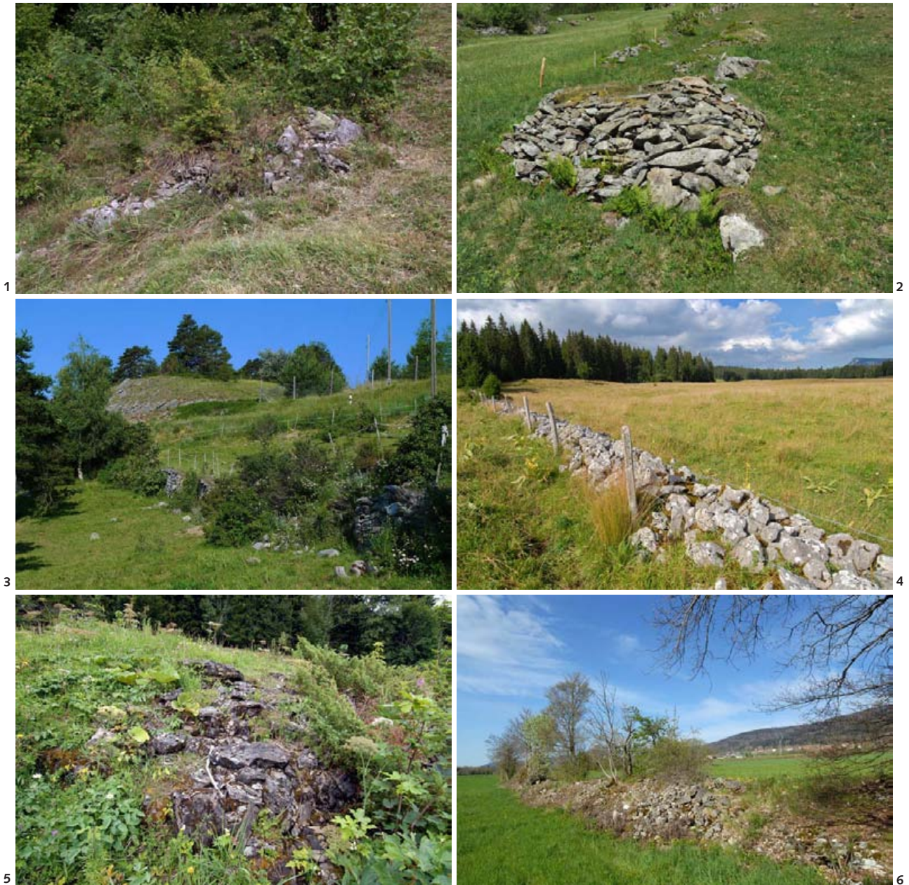
Abb. 1 Traditioneller Lesesteinhaufen am Rand einer Berner Oberländer Heuwiese, für Reptilien ideal strukturiert. Man beachte den teilweisen Bewuchs des Haufens, die unterschiedlich grossen Steine und die optimale Verzahnung mit der umgebenden Vegetation. (AM)