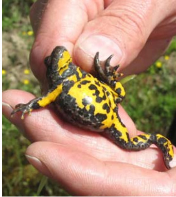
Die auffällige Bauchseite ist namensgebend. Jedes Tier trägt ein individuelles Muster.

Deutschland liegt im Zentrum der Verbreitung und hat daher eine besondere Verantwortung für den Erhalt der Art. In Nord- und Ostdeutschland fehlt die Art weitgehend. Hier findet man stattdessen die Rotbauchunke, die eher im Tiefland lebt, während die Gelbbauchunke auch als „Bergunke“ bezeichnet wird.