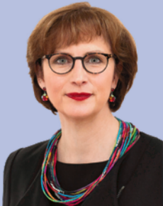
Regierungspräsidentin Brigitte Lindscheid